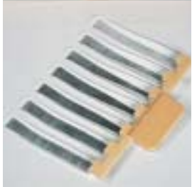
Numerosas possibilidades de desenho com os ancinhos