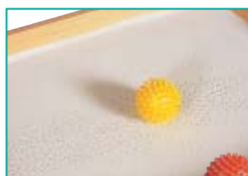
2 joaninhas magnéticas