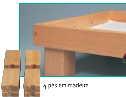
4 pés em madeira