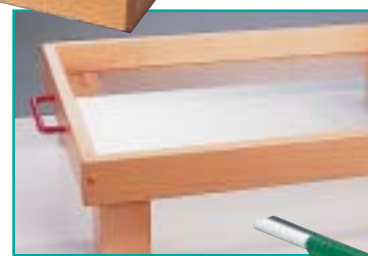
1 raspadeira com um tubo cilíndrico