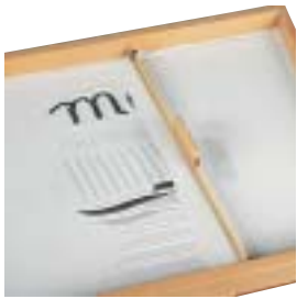
Barra para alisar a areia